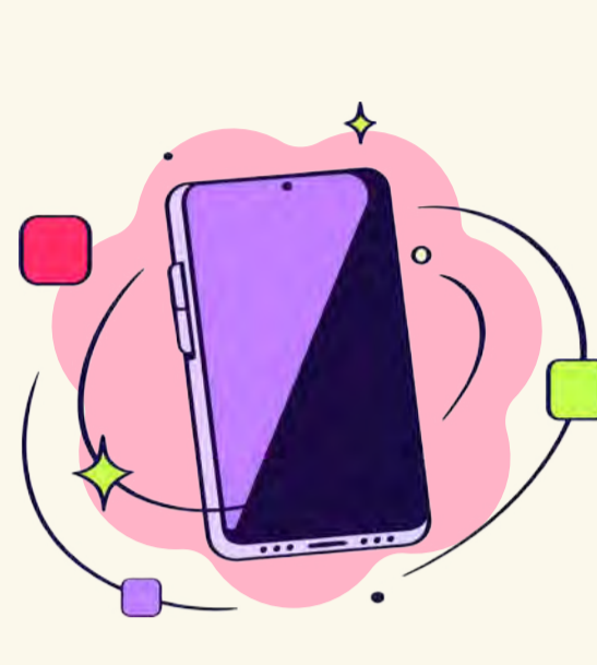
Apps de bem-estar e conteúdo exclusivo