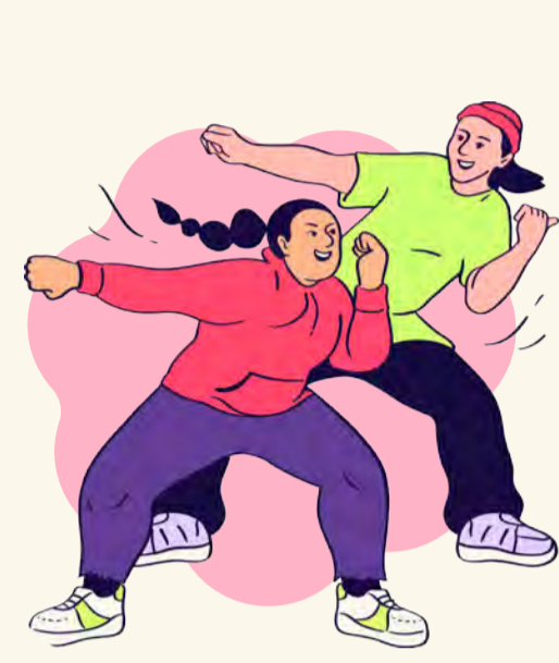
Aulas interativas em grupo

Todos querem se sentir bem, e nós encontramos a melhor maneira de alcançar essa meta. O Wellhub se adapta ao seu estilo de vida, não o contrário. Descubra uma ampla variedade de exercícios e atividades de bem-estar.